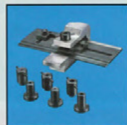
ERIFLEX® FLEXIDRILL R

Varje verktyg kan köpas separat - se sid 13-15