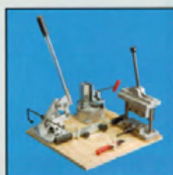
ERIFLEX FLEXIBAR Arbetsbänk